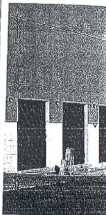
Las compañías asumen