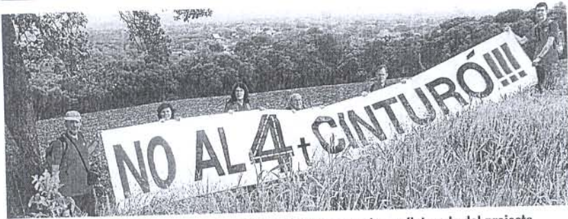
La pancarta de la Plataforma tornarà a sortir al carrer per reclamar l'aturada del projecte