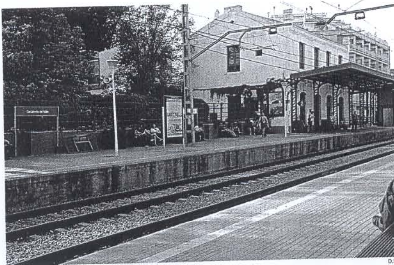
El Govern quiere potenciar la conexión ferroviaria entre Sabadell y Barcelona

A esta nueva línea, transversal entre los dos Vallès, los FGC sumarán otra nueva entre