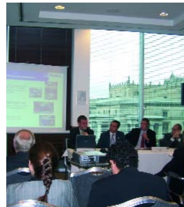
El próximo año se volverá a repetir este Encuentro

De momento, de la decena de empresas participantes, 6 de ellas es posible que se asocien para, ya en Polonia, ofrecer un servicio integral, dado que las 6 están especializadas en procesos productivos diferentes. Además, otras negociaciones ya han fructificado, algo sorprendente teniendo en cuenta que el Encuentro Empresarial se celebró hace sólo un par de meses. Por todo ello, el ICEX apoyará de nuevo este Encuentro el próximo año.