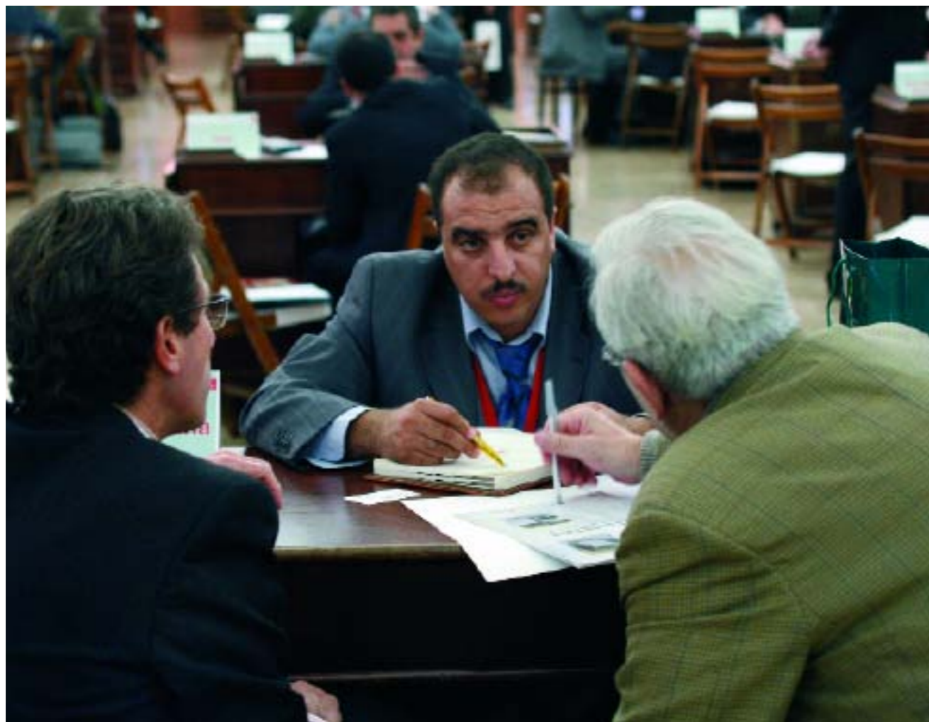
El Forum Económico permitió el contacto entre empresarios

Un centenar de empresarios argelinos se reunieron el pasado 30 de noviembre en la Llotja de Mar para asistir al Forum Económico sobre Argelia, un país que ha sido siempre prioritario para la Cámara de Barcelona y que el próximo año contará con un plan económico empresarial específico dentro del Plan de Acción Internacional.