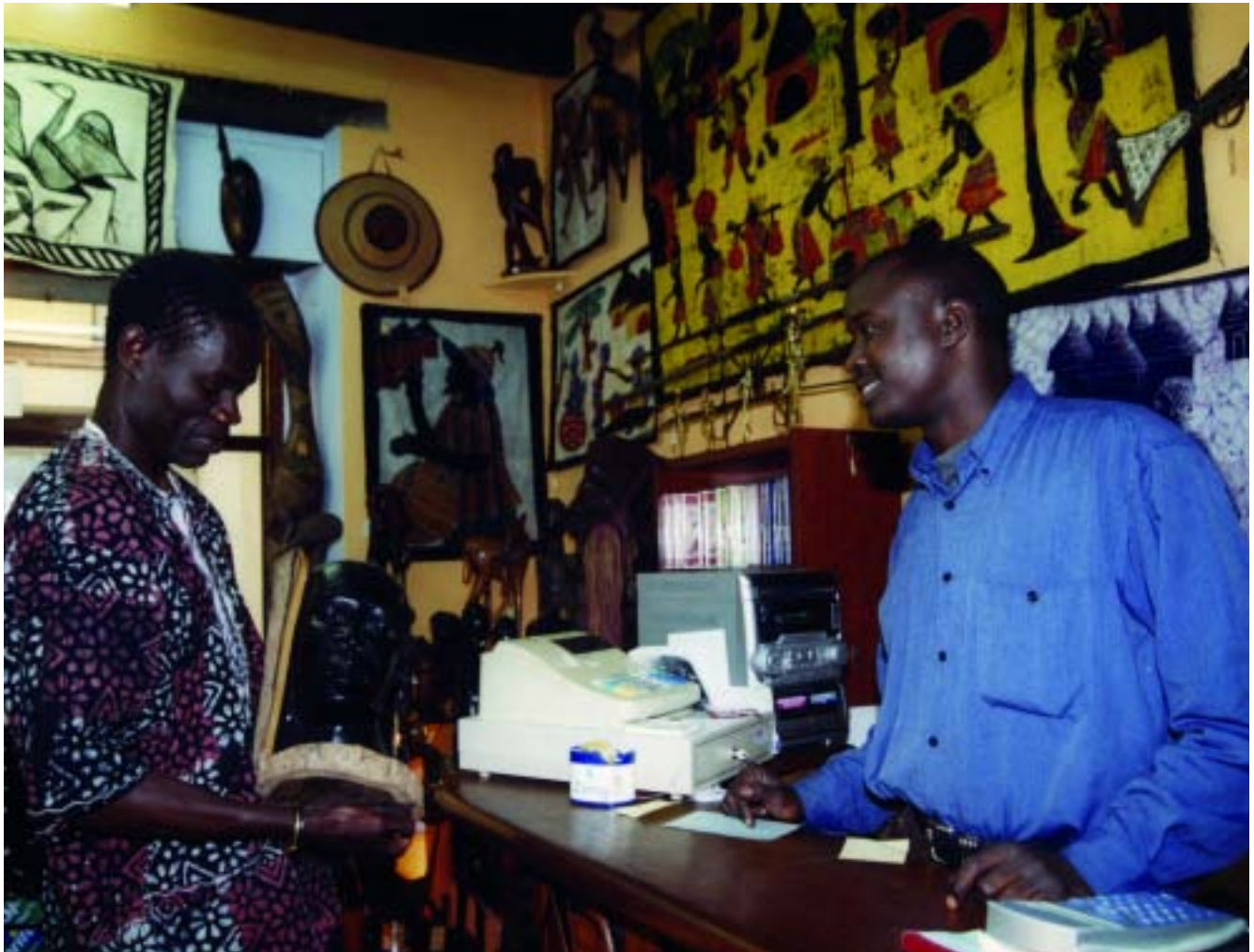
El comerç s'ha convertit en una de les millors maneres d'integrar la població nouvinguda

La capital del Pla de l'Estany, Banyoles, ha acollit un significatiu nombre de nouvinguts que han trobat en el petit comerç una via de sortida econòmica. La Cambra de Girona ha publicat un estudi que analitza aquests establiments, sovint especialitzats en productes ètnics, i proposa noves mesures per millorar-ne l'activitat comercial.