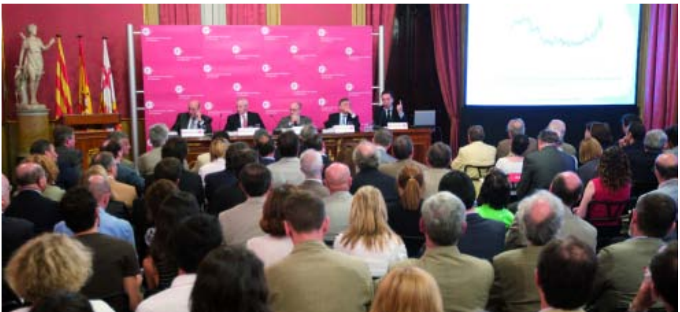
Com cada any, les cambres van presentar aquest estudi de referència sobre l'economia catalana

Després de 42 edicions ja es pot dir que la Memòria econòmica de Catalunya és una obra de referència al Principat per conèixer la situació real de l'economia catalana. Editada pel Consell de Cambres de Catalunya, la darrera edició es va presentar a la Llotja de Mar de Barcelona a final del mes de juliol.