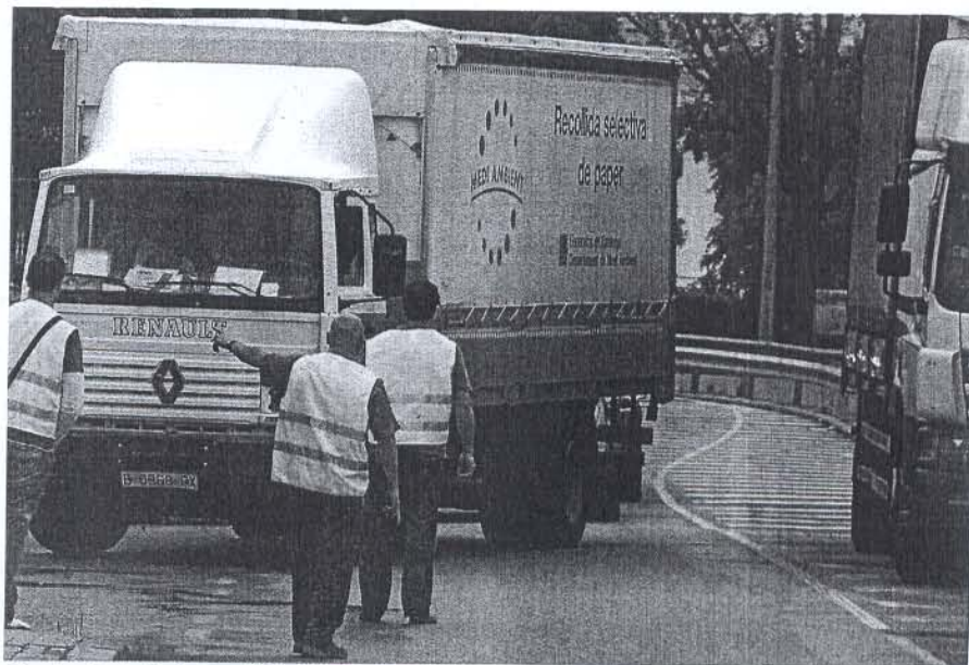
Piquets a l'entrada de Sabadell desviant els camions dimarts passat

Els efectes més negatius de la vaga, però, s'han donat lluny dels comerços. I és que moltes indústries han començat expedients reguladors per cobrir les despeses que la falta de subministraments ha ocasionat. ■