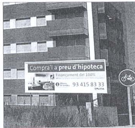
Habitatges amb les obres aturades i altres que porten mesos en venda a Sabadell (esquerra) i als barris de Vullpalleres i Turó de Can Matas, a Sant Cugat del Vallès