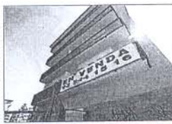
Un edifici amb tots els habitatges per vendre ■ ROBERT RAMOS

■ Això és el que va passar a Terrassa i a Sant Cugat del Vallès, per exemple, dos dels consistoris que han fet més plans urbanístics en els darrers temps a la comarca i dues localitats on el nombre de vivendes buides és