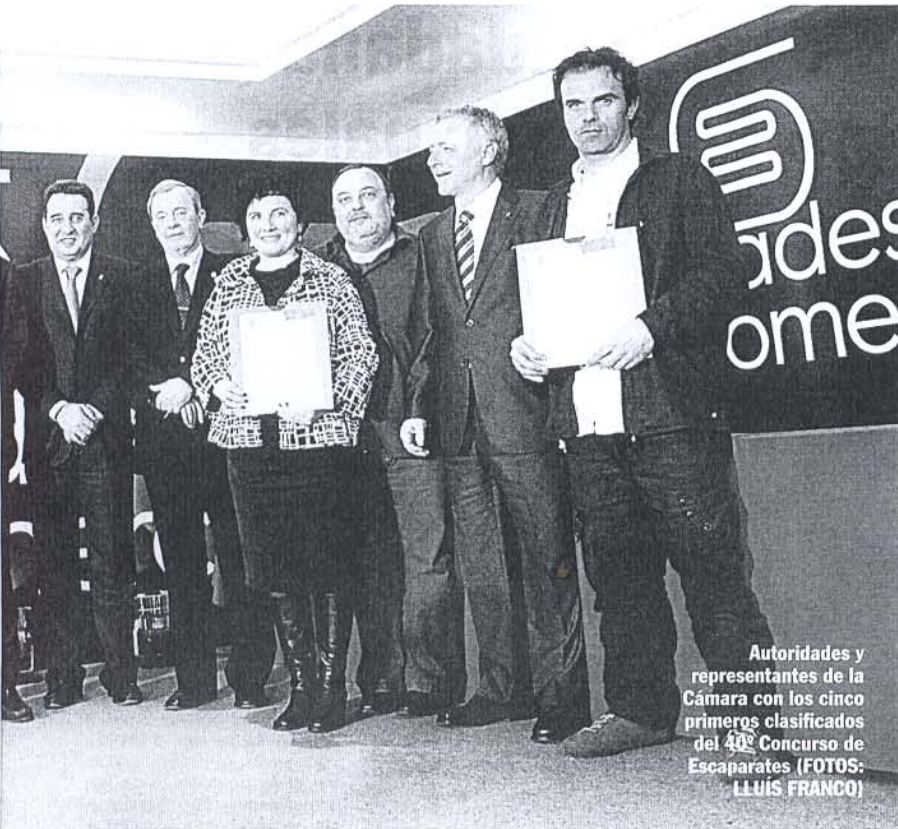
Autoridades y representantes de la Cámara con los cinco primeros clasificados del 40º Concurso de Escaparates