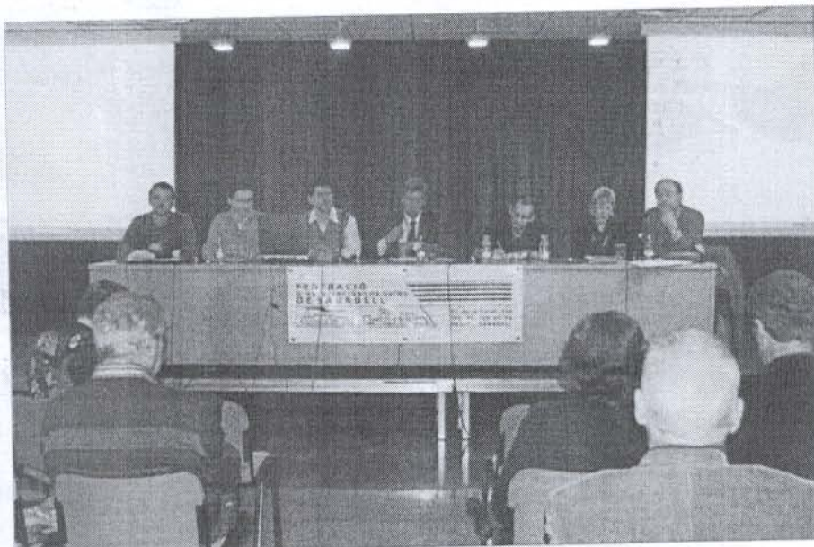
■ Els membres de Promoció del Transport Públic, la UES, la Cambra, l'ADENC, Sabadell Cruïlla i la FAV ■ C.F.

Pel que fa a les propostes que es van posar sobre la taula, destaca el consens general que falta un Pla de Diagnosi de Mobilitat, que actualment ja s'està desenvolupant, a més de l'afirma-