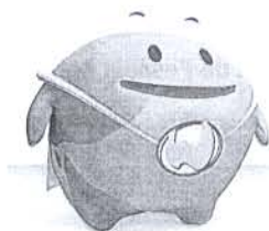
La mascota 'Woly'

Esta iniciativa se inscribe en el acuerdo de colaboración suscrito con la ONG británica