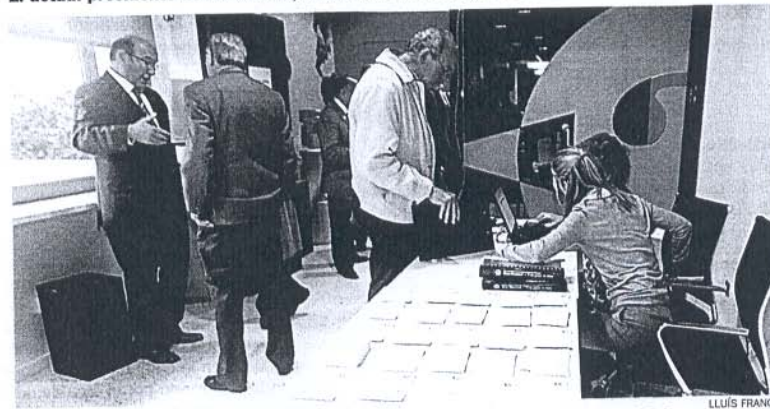
Los empresarios de la demarcación ejercieron el derecho al voto de 10 a 18 horas