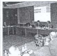
La Cambra va acollir fa uns dies a Tabasa ■ AVUISABADELL

Des de la Cambra s'insisteix en què aquest model de gestió d'infraestructures va encara més enllà, ja que incorpora elements innovadors, com són els pro-